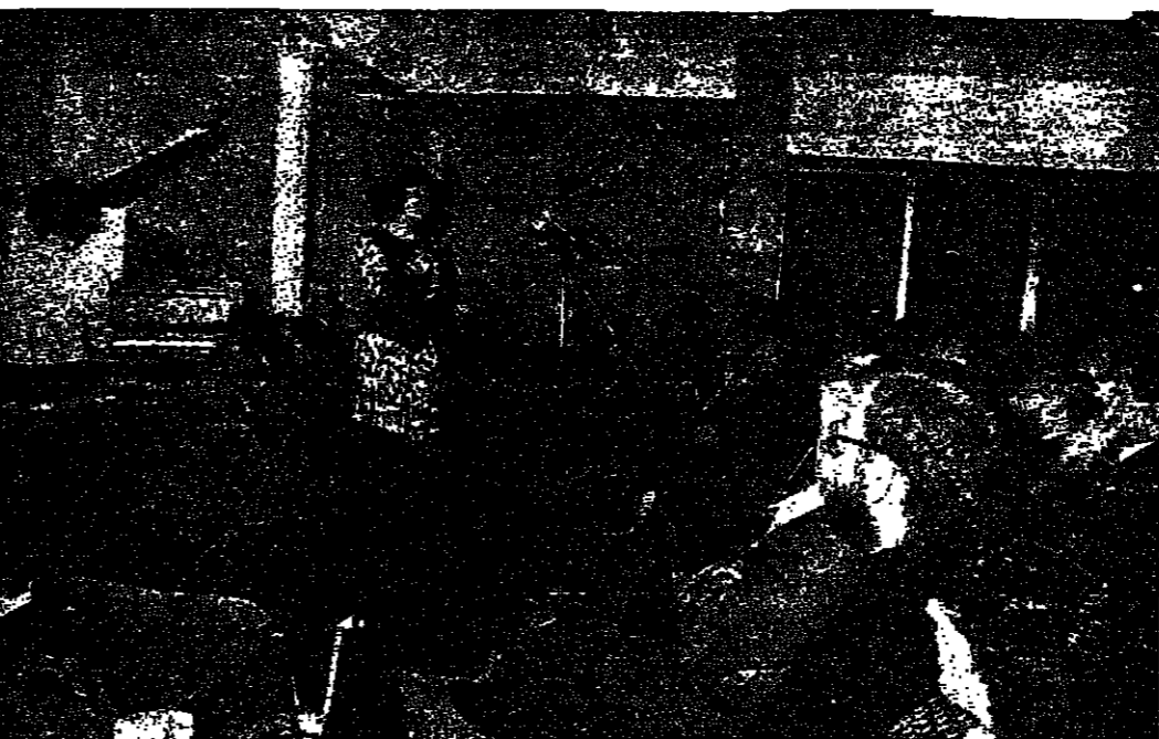
من: التراث الفني اللبناني